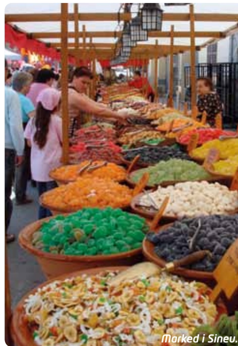
Marked i Sineu.