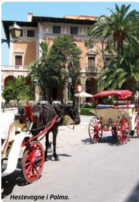
Hestevogne i Palma.