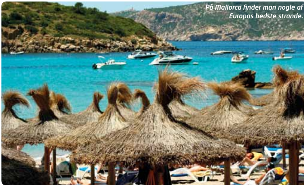
På Mallorca finder man nogle af Europas bedste strande.