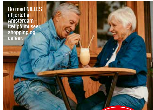
Bo med NILLES i hjertet af Amsterdam - tæt på museer, shopping og caféer.