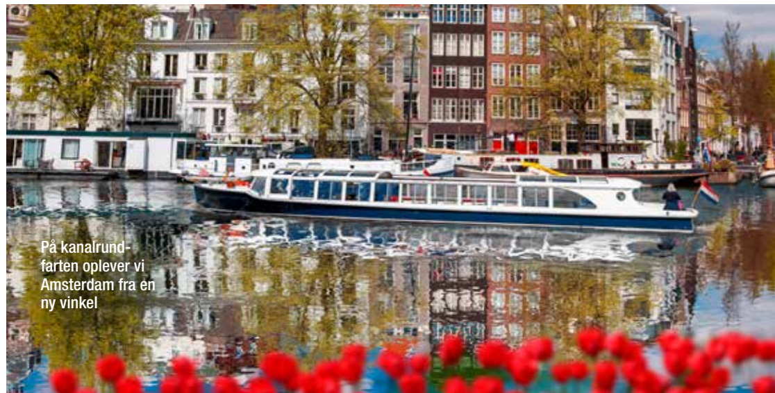
På kanalrundfarten oplever vi Amsterdam fra en ny vinkel